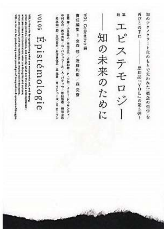
『VOL05 特集：エピステモロジー——知の未来のために』 (以文社、2011年)